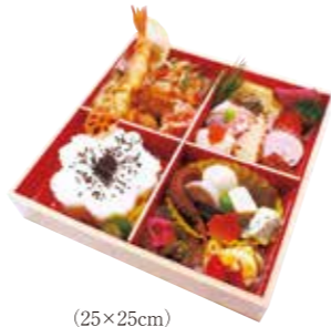
(25×25cm) 花咲弁当 2,500円(税込)