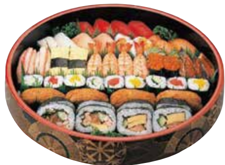
あんず 4人用 4,800円(税込) にぎり10種 しんごきゅうり・てっか サラダ巻・イナリ