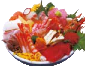
えびすや ものがたり丼 3,200円(税込)