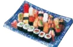
マンブク 1.8人用 2,300円(税込)