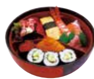
お子様ずし 950円(税込)