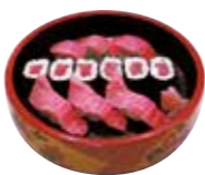
とろづくし 3,150円(税込)