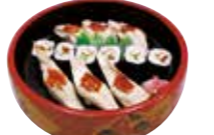
穴子づくし 2,200円(税込)