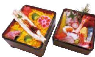
特上ちらし 3,100円(税込)