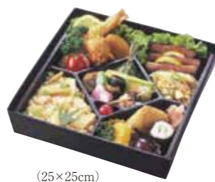
(25×25cm) つどい弁当 1,850円(税込)