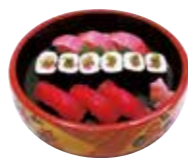
まぐろづくし 2,300円(税込)