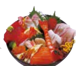
よろこび丼 2,500円(税込)