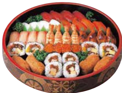
ひのき 4人用 4,800円(税込) にぎり7種 上巻ずし・巻ずし イナリ