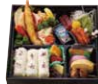
お子様弁当 1,800円(税込)