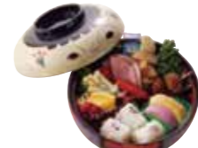
お子様ランチ 1,300円(税込)