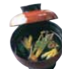
赤出し すまし汁 350円(税込)