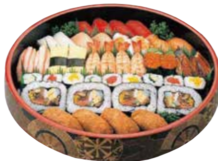
すみれ 4人用 4,800円(税込) にぎり10種 しんごきゅうり・てっか 特上巻・イナリ