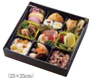
(25×25cm) えびすや弁当 1,600円(税込)