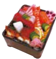
海鮮ちらし 1,500円(税込)