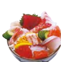
しあわせ丼 1,700円(税込)