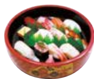
ゆり 1.2人用 1,650円(税込)