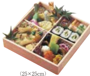
(25×25cm) 行楽弁当 1,750円(税込)